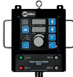
分体控制器 远控操作盒