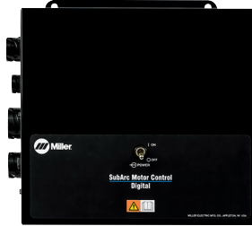
分体控制器 驱动控制箱